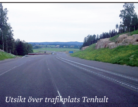
Utsikt över trafikplats Tenhult

Ove Syrén, markförhandlare, Trafikverket, 036-19 21 79, 070-519 21 79