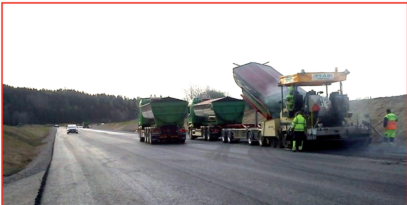
Bilderna ovan och under är tagen mellan Järnvägen och Huskvarnavä-