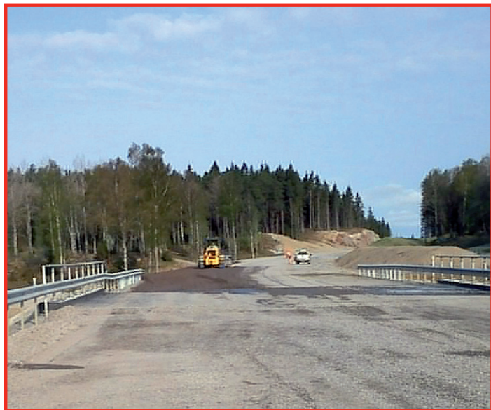
Bilden är tagen vid Käveryd.

Vi kommer även att sätta upp bullerplank, viltstängsel och vägräcken utmed sträckan.