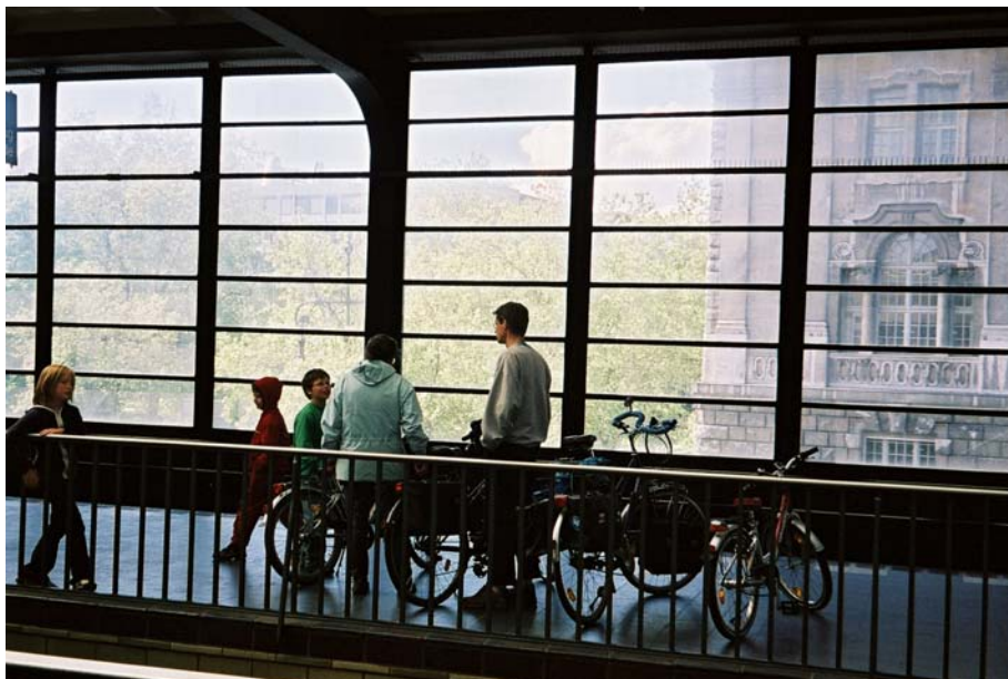
En familj på söndagsutflykt i centrala Berlin

Att ta med sig cykel på tåget möjliggör för resenären att både ta cykeln till stationen och väl framme vid sin destination cykla vidare till sitt slutmål. Detta är speciellt viktigt för icke bilnehavare. Härigenom kan man i tätbyggda områden med överskridna miljökvalitetsnormer och brist på parkeringsplatser klara sig hyfsat utan bil. Förutom de positiva effekter på hälsa och trängsel som detta medför så är det mycket positivt ur miljösynpunkt eftersom kortväga biltransporter är de biltransporter som är klart sämst ur miljösynpunkt och därför bör undvikas i största möjliga utsträckning.