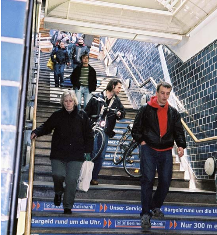
Starka ungdomar bär lätt sin cykel. Här i Berlin.

Övriga tåg: Inlandsbanan transporterar cyklar idag. Dessa bör förbokas och transporten kostar 100 kr/sträcka.