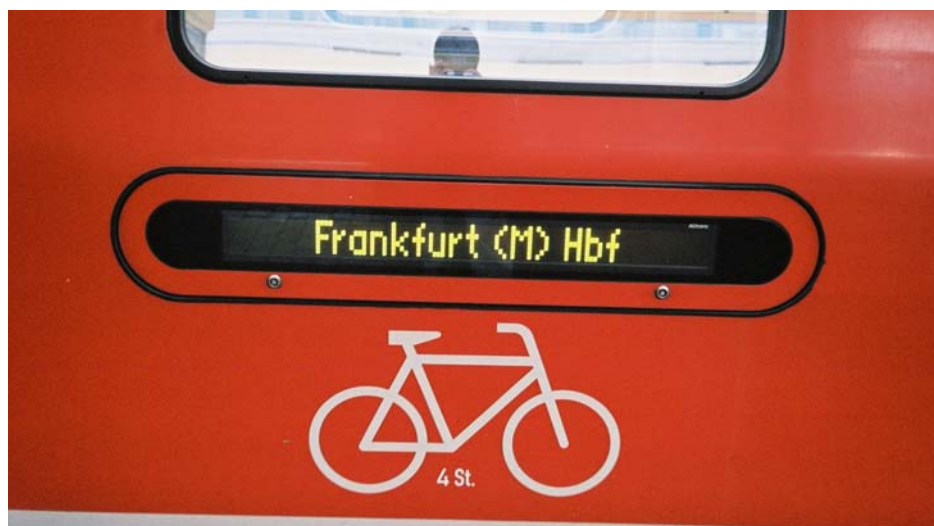
På tyska tåg utmärks ofta de vagnar som tar cyklar med denna symbol.

För 8 Euro kan man ta med sig cykeln på ett interregionalt tåg enkel väg. På regionaltågen är kostnaden betydligt mindre eller gratis. Man kan även skicka cykeln ensam genom att låta en kurirservice leverera cykeln till rätt destination inom 2-3 arbetsdagar. www.db.de