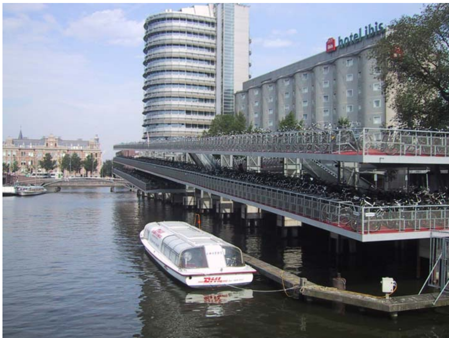
I Amsterdam finns ett 3-vånings cykelparkeringshus med plats för 1000 cyklar.

Banverket agerar redan idag utifrån sitt sektorsansvar för att goda cykelparkeringar ska anordnas vid nya eller ombyggda resecentrum. I Stockholm har man t.ex. låtit utföra en utredning som analyserar behovet och visar på möjligheten att anordna cykelparkering i anslutning till Citybanans nya stationer. Det finns även möjligheter för trafikhuvudmannen att få statsbidrag med upp till 50 % för att bygga dessa cykelparkeringar.