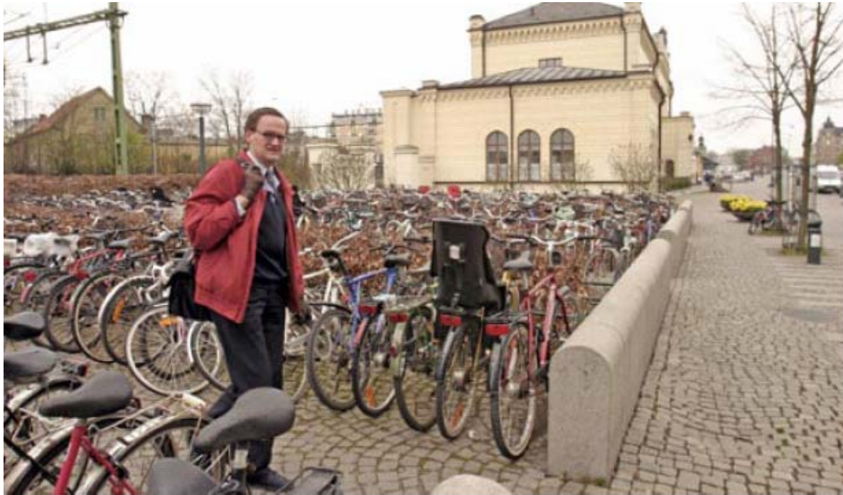
Cykelparkeringen vid Lunds central tillhör de bästa i landet.