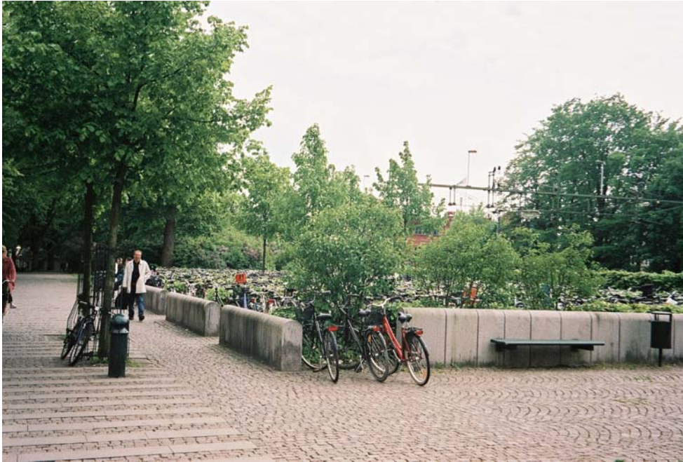
Cykelparkering vid Lunds station. Utmärkt inhägnad men platserna räcker inte till.

Cykel på tåg: Här berättade Rikstrafiken om sin förstudie och hur situationen såg ut i Sverige när förstudien gjordes för ett år sedan. Marco Danzi från Polen/Tyskland beskrev transportsituationen i Tyskland, med utblickar mot bl a Frankrike och Schweiz. Han berättade också om hur cykelturismen utvecklats i Tyskland. Banverket redogjorde för problem med att komma till perrongen, speciellt när cykeln måste transporteras genom stationsbyggnaden. Vidare berättade en representant från Bombardier hur enkelt det kan vara att anpassa Reginatågen så att man får en flexibel del med fällbara säten (som kan utnyttjas för bl a cyklar). Åtgärden tar bara ett par timmar per tåg och kostnaden är därför låg.