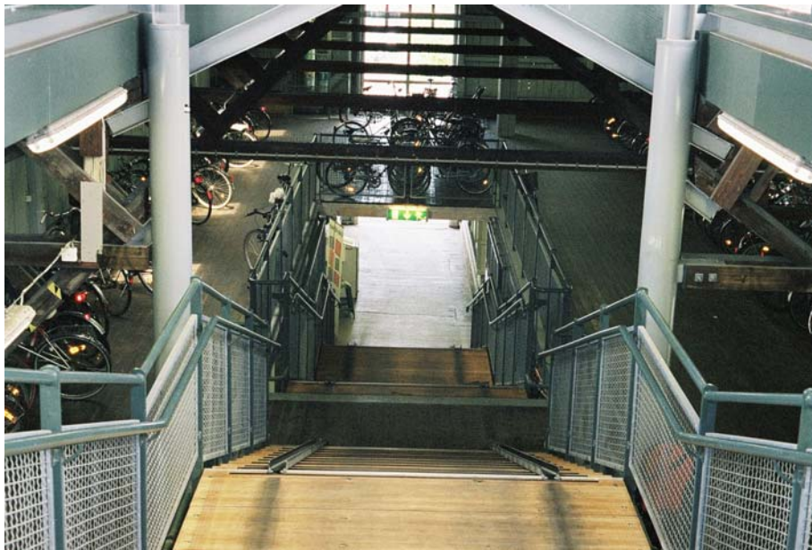
Ett gott exempel på cykelstation; ett före detta godsmagasin, numera bevakad cykelparkering i två plan, Lund

Utomlands lyfts ofta förebilder som Odense i Danmark, Leiden och Gouda i Holland. I Tyska Westfalen finns vid ett 60-tal järnvägsstationer så kallade cykelstationer med både parkering, bevakning, uthyrning, service och försäljning.