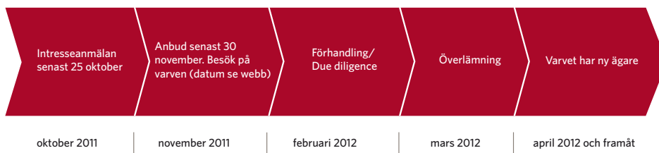
Figur 2. Processbeskrivning: försäljning av Tenö varv.

Det första steget i försäljningen av Färjerederiets varv är intresseanmälan. Syftet med intresseanmälan är att med en begränsad arbetsinsats kunna avgöra om det är värt att gå vidare i nästa steg i processen som kräver en betydligt större insats från båda parter. Därefter väljs de parter ut där stor intressegemenskap finns mellan Trafikverket och den presumtiva köparen. Dessa ges möjlighet att lämna anbud samt besöka varven. I nästa steg inleds en förhandling med ett fåtal parter som lämnat de mest förmånliga anbuden. När köpeavtalet undertecknats genomförs slutligen en överlämning mellan parterna.