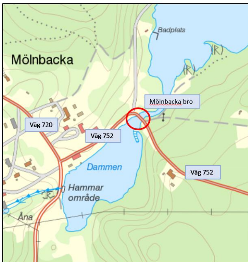
Figur 1. Översiktlig karta över projektområdet.