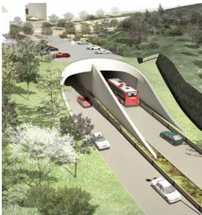
Bilden visar av- och påfartsramperna vid Skattegårdsvägen för trafik i norrgående riktning. Illustration: &Rundquist

Vecka 28-31 ligger tunneldriften nere, det vill säga vi spränger inte i tunneln. Andra underhållsarbeten som inte är störande kan förekomma.