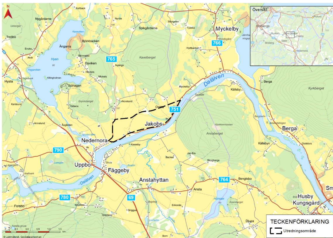
Figur 1. Översiktskarta över utredningsområdet.