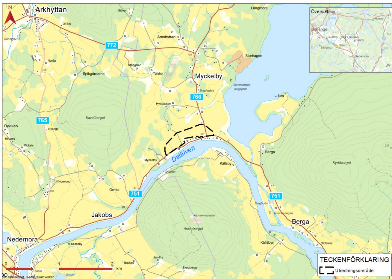
Figur 1. Översiktskarta över utredningsområdet.