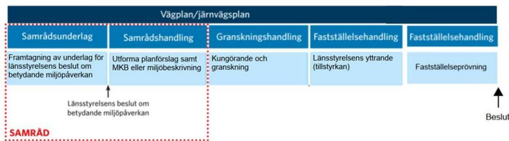
Figur 1. Planläggningsprocessen för väg- och järnvägsprojekt.

Samråd är en viktig del av planläggningsprocessen och kommer att hållas kontinuerligt under projektets gång. Det innebär att Trafikverket tar kontakt och för dialoger med berörda kommuner, länsstyrelsen, myndigheter, organisationer, berörd allmänhet m.fl. för att få in synpunkter och kunskap för att kunna utforma en så bra lösning som möjligt.