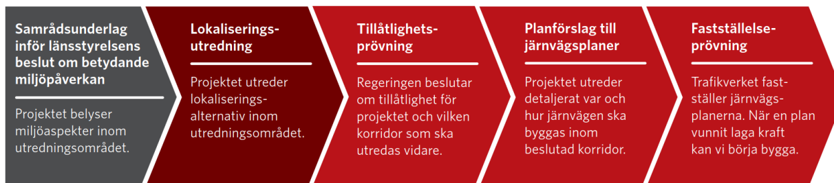
Figur 1 Göteborg-Borås planläggningsprocess för järnvägsplan. Mörkt block visar vilken fas som pågår nu. Grått block visar avslutad fas.

När en ny järnväg ska planeras inleds en planläggningsprocess som regleras av lagen om byggande av järnväg. I processen tar Trafikverket fram en järnvägsplan, som visar var och hur järnvägen ska byggas. Planläggningsprocessen kommer för det här projektet att innehålla fem faser. Dessa beskrivs kort i figur 1 nedan.