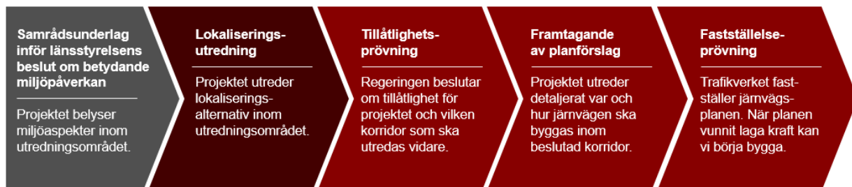
Figur 1 Planläggningsprocessen. Mörkt block visar vilken fas som pågår nu.

När en ny järnväg ska planeras inleds en planläggningsprocess som regleras av lagen om byggande av järnväg. I processen tar Trafikverket fram en järnvägsplan, som visar var och hur järnvägen ska byggas. Planläggningsprocessen kommer för det här projektet att innehålla fem faser. Dessa beskrivs kort i figur 1 nedan.