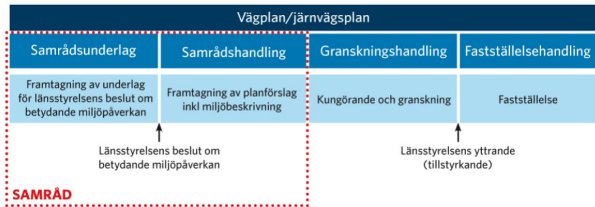
Figur 1 Trafikverkets planläggningsprocess "Typfall 2": vägplan med icke betydande miljöpåverkan.

Samrådsunderlag är benämningen på den status som planen har under planläggningens tidiga skede, till och med länsstyrelsens beslut om betydande miljöpåverkan. Samrådsunderlaget redovisar översiktligt områdets förutsättningar, vilka åtgärder som planeras samt vilka konsekvenser detta bedöms få för människa och miljö.