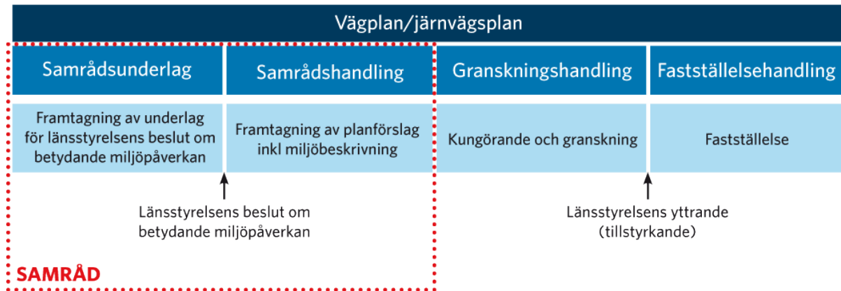
Figur 1: Trafikverkets planprocess för projekt E4/E20 Södertäljebron kapacitetsförstärkning.

Projektet följer Trafikverkets planeringsprocess där samråd sker kontinuerligt under processen. De handlingar som tas fram i projektet beskrivs i figuren nedan.