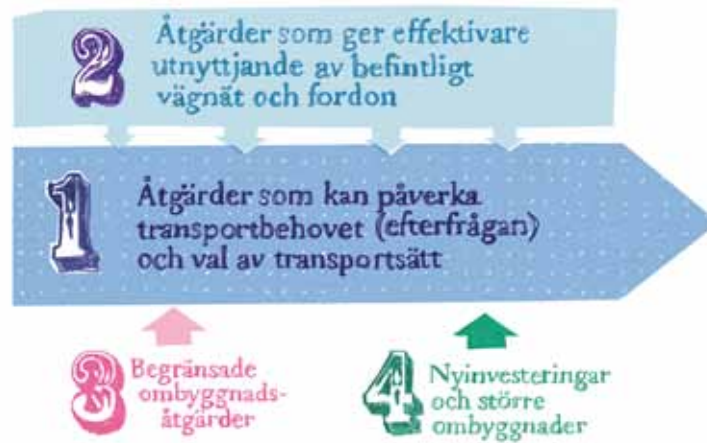
Figur 3: Ett kontinuerligt arbete med hållbart resande i fyrstegsprincipens steg 1 och 2 minskar behovet av åtgärder i steg 3 och 4. Även åtgärder i steg 3 bör provas och användas mer frekvent än åtgärder i steg 4.

men även den offentliga sektorns upphandling av varor och tjänster kan inverka.