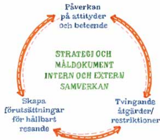
Figur 2: Planer och verksamhet för "hållbart resande" måste samordnas med övrig kommunal verksamhet, och utformas så att den tydligt bidrar till kommunens övergripande utvecklingsmål (figuren visar ett exempel på samordning).