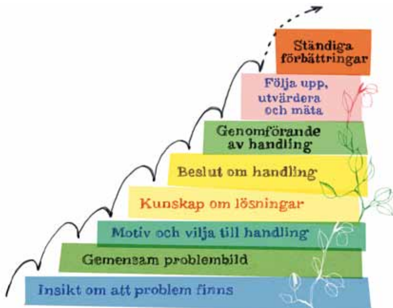
Figur 4: Steg i en så kallad utvecklingstrappa som på ett förenklat sätt beskriver en verksamhets eller organisations stegvisa utveckling.

tera i en integrering i den ordinarie verksamheten kan jämföras med att utvecklingen följer en trappas olika steg (se illustration ovan).