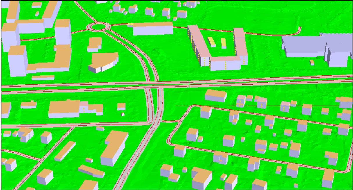
Figur 2 Urklipp från SoundPlan visar dagens korsning.

Ljudnivåerna har beräknats i enlighet med "Nordisk beräkningsmodell" för vägtrafik. Beräkning och redovisning av ljudutbredning har tagits fram med programmet SoundPLAN 7.4. I detta program konstrueras som bas för beräkningarna en tredimensionell modell av området, inkluderat vägar, byggnader och övriga ytor. Figur 2 visar modellen av nuvarande korsning i SoundPlan. Trafikmängder och andra trafikförutsättningar för E18, Selma Lagerlöfs väg, Häsängsvägen och Skrantahöjdsvägen har lagts in i modellen. För nollalternativet och planalternativet används trafikmängder för prognosår 2040 då bullerutredningar har krav på sig att ta höjd för framtida trafikökning.