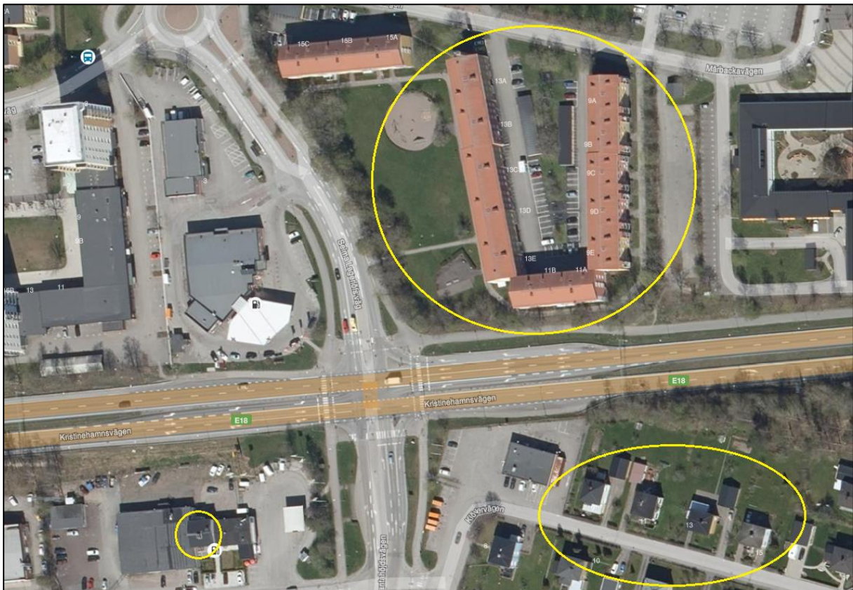
Figur 1 Ortofoto över korsningen som är aktuell för ombyggnad. Fastigheterna inom de gula ringarna utreds i bullerutredningen.

Figur 1 visar den aktuella korsningen och de fastigheter som är inkluderade i trafikbullerutredningen.