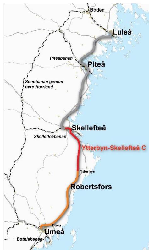
Figur 1. Norrbotniabanan med Etapp 1, Umeå Skellefteå och sträckan Ytterbyn-Skellefteå C.

En ny järnväg mellan Umeå och Luleå ger möjlighet till både tyngre och längre tåg. Med Norrbotniabanan beräknas företagens transportkostnader minska med upp till 30 procent. En sådan effektivisering får inte bara genomslag i norr utan i hela landet eftersom mer än hälften av den tunga godstrafiken kommer från norr med destination i söder. Norrbotniabanan innebär att den regionala persontrafiken mellan Umeå, Skellefteå, Piteå och Luleå kan utvecklas. Restiderna på sträckan kan med Norrbotniabanan halveras, något som förstärker möjligheterna till arbetspendling.