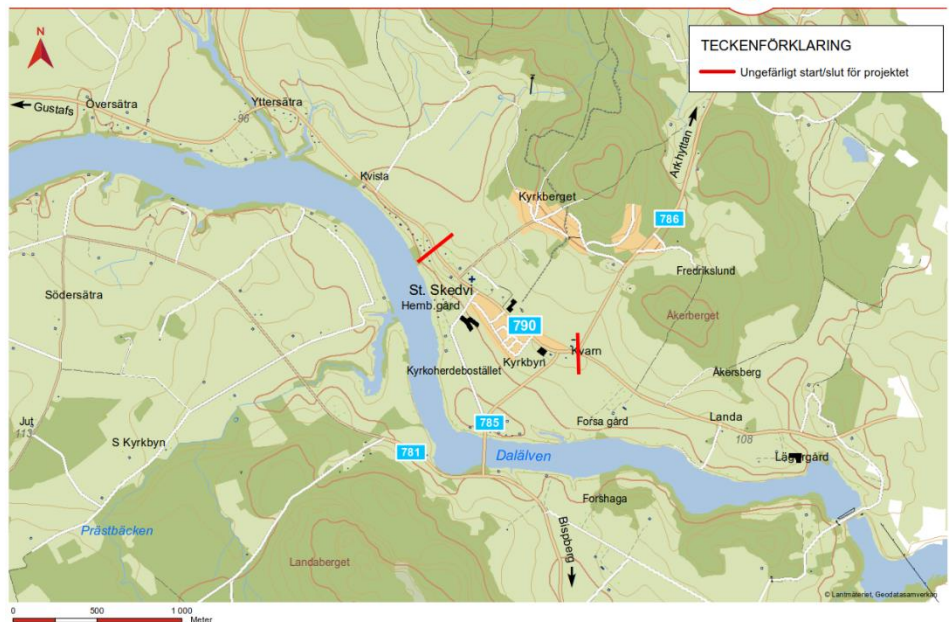
Figur 1: Översiktsbild för projektets utsträckning i Stora Skedvi

Projektet omfattar trafiksäkerhetshöjande åtgärder för oskyddade trafikanter på väg 790 genom Stora Skedvi kyrkby (längd ca 1 km) genom en om/nybyggnation av gång- och cykelväg. Säkra passager saknas över väg 790 där många för- och grundskolebarn passerar, dessa ses nu över och förbättras längst sträckan för att knyta samman målpunkter. Den smala passagen vid kyrkan vållar idag framkomlighetsproblem, denna ses över och förbättras i och med om/nybyggnationen av gång- och cykelvägen. Samt översyn av befintliga busshållplatser och belysningen utreds.