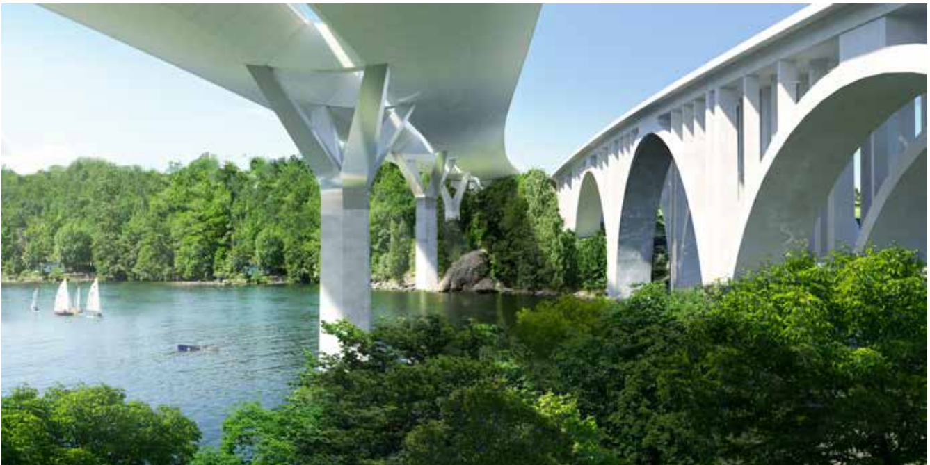
Den nya Skurubro byggd söder om den gamla. Illustration: Dissing+Weitling.

Trafikverket ska bygga en ny Skurubro och bygga om trafikplatserna Skuru och Björknäs. När vi är klara blir det lättare för alla trafikanter att ta sig fram och regionen kan fortsätta att utvecklas.