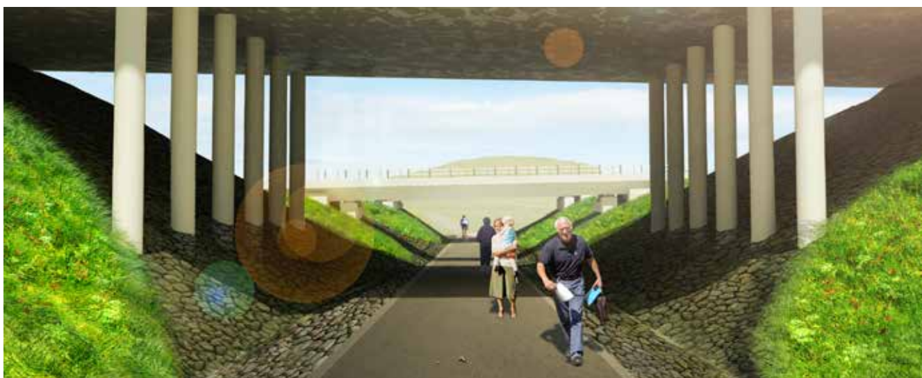
Gång- och cykelpassagen under Värmdöleden blir öppnare och ljusare, för att skapa en tryggare miljö för dig som går och cyklar.

Åse Wallin, projektledare Trafikverket, Telefon: 010-123 73 09, E-post: ase.wallin@trafikverket.se