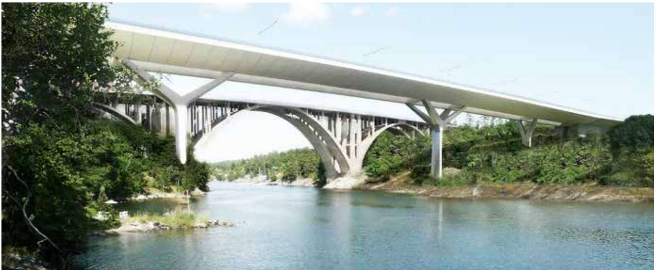
Illustration: Dissing+Weitling. Vi bygger den nya Skurubron söder om den befintliga bron.

Nu har vi påbörjat bygget med den nya Skurubron och ombyggnaderna av trafikplatserna Skuru och Björknäs. När vi är klara blir det lättare för alla trafikanter att ta sig fram, och Nacka och Värmdö kan fortsätta att växa.