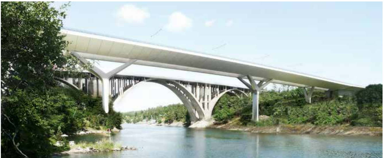
Illustration på den nya Skurubron som är ritad av arkitektbyrån Dissing+Weitling.

Trafikverket och Värmdö kommun deltar. Trafikverket informerar om projektet och du får möjlighet att ställa frågor. Det blir även aktiviteter för barn.