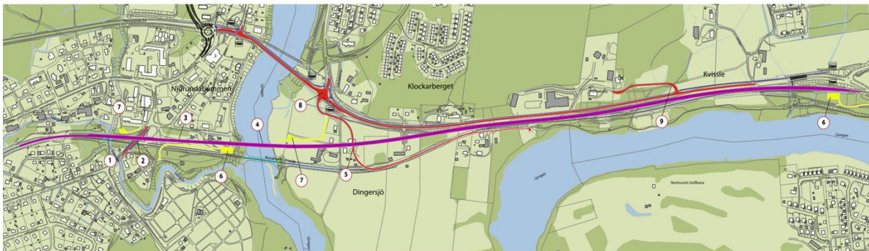
Figur 1 Planerad järnväg

Planerad förlängd mötesstation på Ostkustbanan ligger mellan Njurundabommen och Nolby. Den nya mötesstationen kommer att medge ökad trafik och förbättrad punktlighet på Ostkustbanan. Mötesstationen är utformad så att den kan utgöra en del i ett framtida dubbelspår mellan Gävle och Sundsvall. Den förlängda mötesstationen omfattar följande: