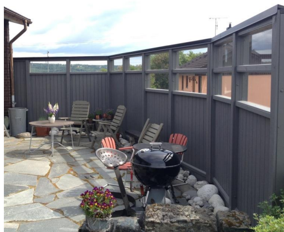
Exempel på uteplats med lokal bullerskärm.

Vi kommer att kontakta de fastighetsägare vars bostadshus vi behöver utreda för fastighetsnära åtgärder.