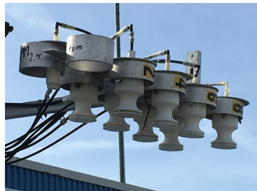
Mätinstrument för partiklar och damm