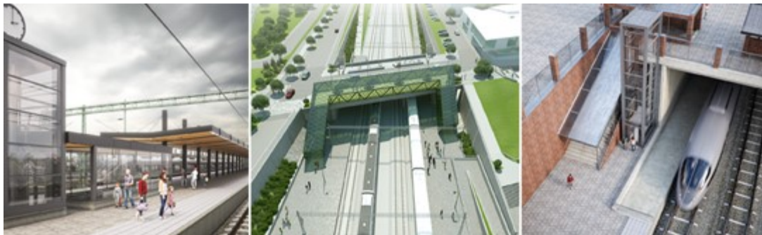
De framtida stationerna Burlöv, Hjärup och Åkarp.

Planeringen för att bygga fyra spår mellan Lund och Arlöv fortsätter. Förberedelser görs inför byggstarten på sträckan Flackarp–Arlöv och arbete med att ta fram en järnvägsplan för sträckan Lund–Flackarp pågår.