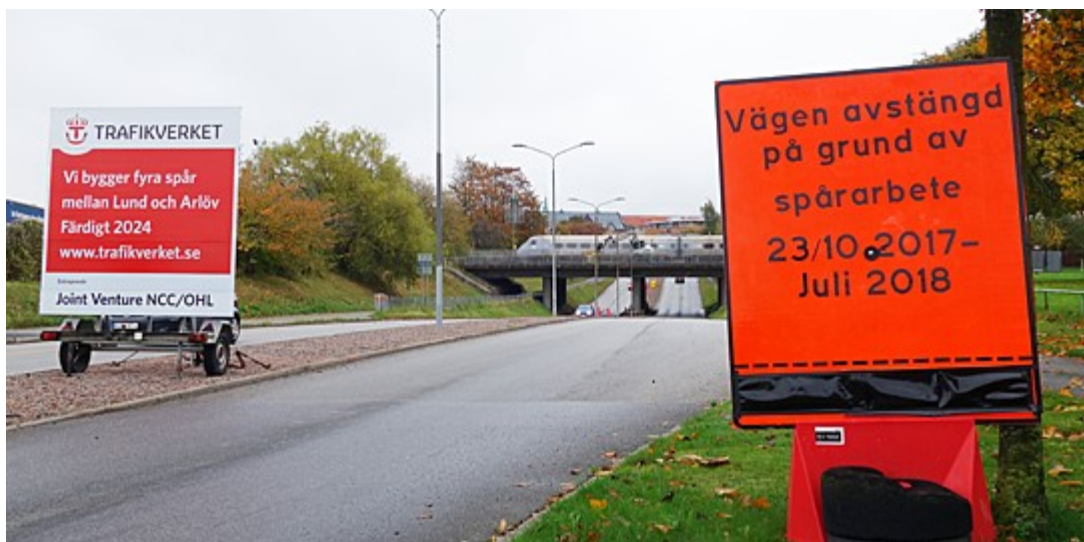
Lommavägen i Arlöv

Den 23 oktober startar det första broarbetet i projektet när järnvägsbron över Lommavägen i Arlöv ska breddas. Då stängs Lommavägen och öppnar igen till sommaren.