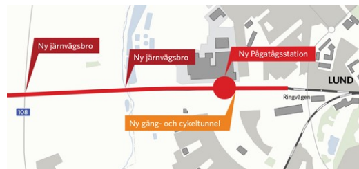
Planen för fyrspårsutbyggnaden i södra Lund