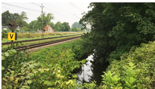
Alnarpsån genom Åkarp