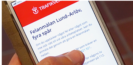
Ladda ned vår app.