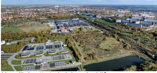
Hur vill du att stadsdelen ska bli?

➔ Här kan du läsa mer om arkeologernas arbete och fynd