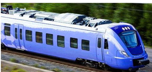
Lommabanan ska underlätta för vardagspendlare.