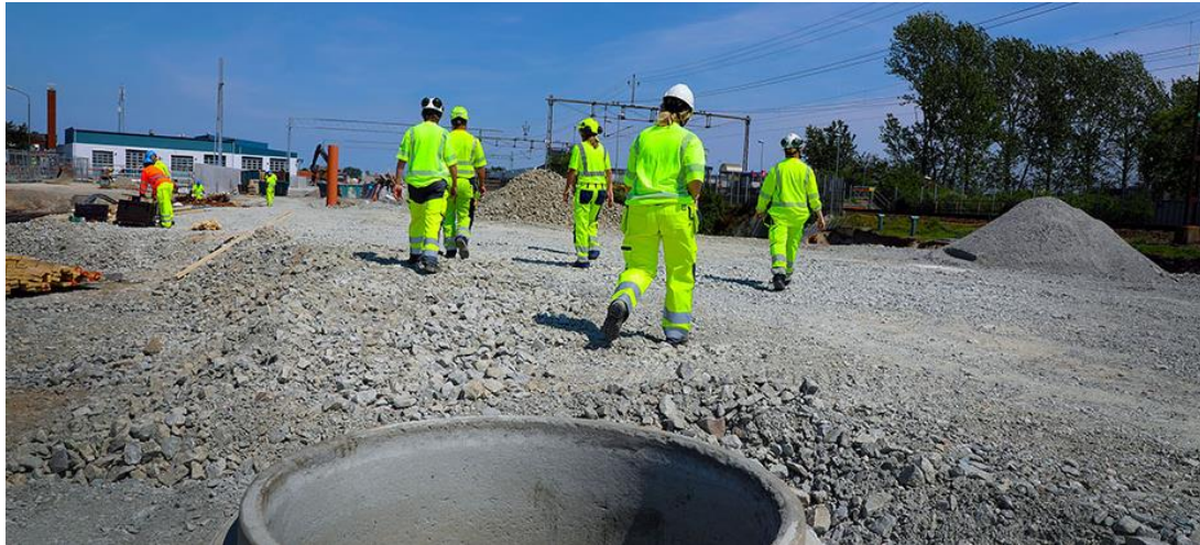
Arbete vid Burlövs station.

Ökad kapacitet – Färre trafikstörningar – Minskat buller