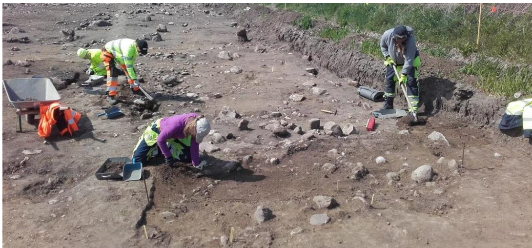
Gravarna bedöms vara från yngre stenålder, 4 000 f Kr–1 700 f Kr.