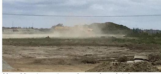
När vi hanterar sten och grus kan det damma.