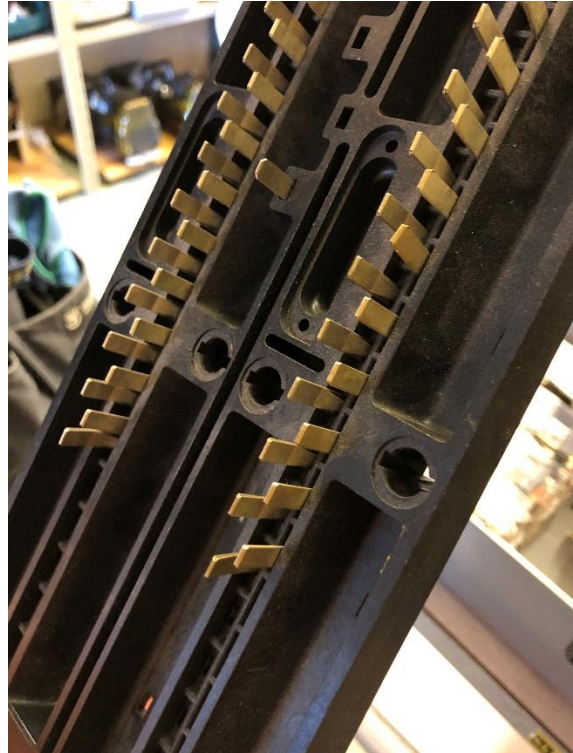
Modell ny JAZ-plint med dubbelvikta stift för låsning.