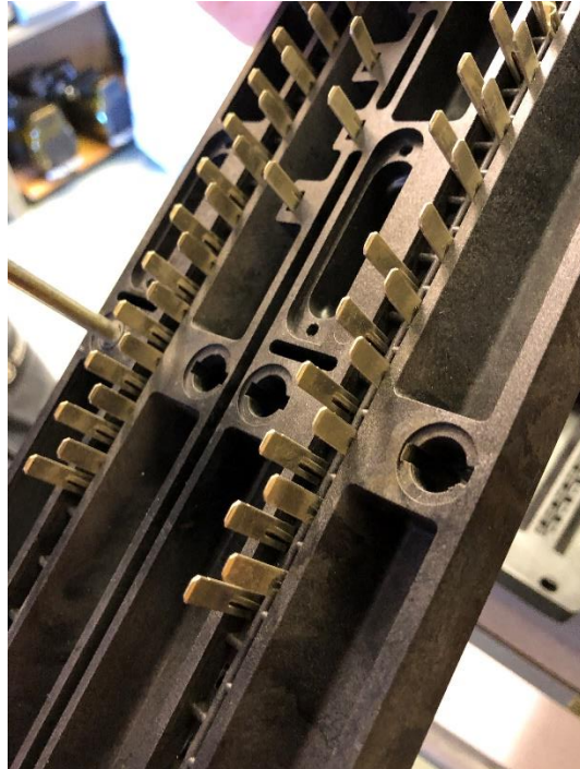
Modell ny JAZ-plint med tunna fjäderstift som är utpressade för låsning. Här gäller att se upp, så att inte stiften har åkt ut efter reläbyte. Denna nya typ av plint är den som är behäftad med ovanstående beskrivna problem.