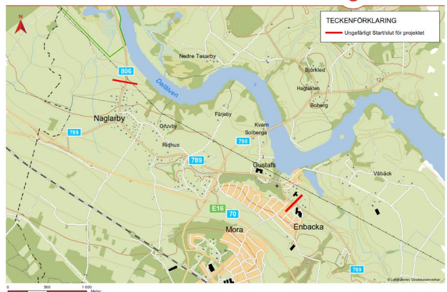
Figur 1: Översiktsbild för projektets utsträckning i Gustafs