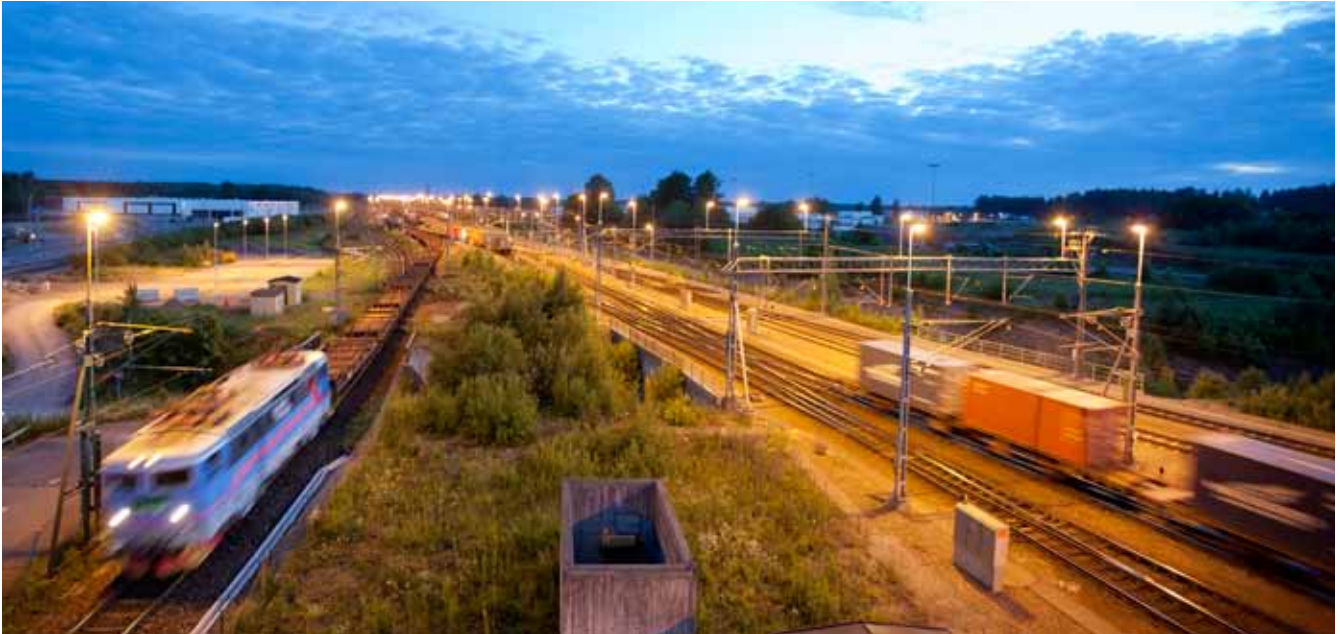
Hallsbergs bangård.

Projektet Hallsberg – Degerön är en del av utbyggnaden av godsstråket genom Bergslagen. Trafikverket arbetar med fyra olika sträckor inom projektet. I detta informationsbrev berättar vi vad som händer på respektive sträcka.