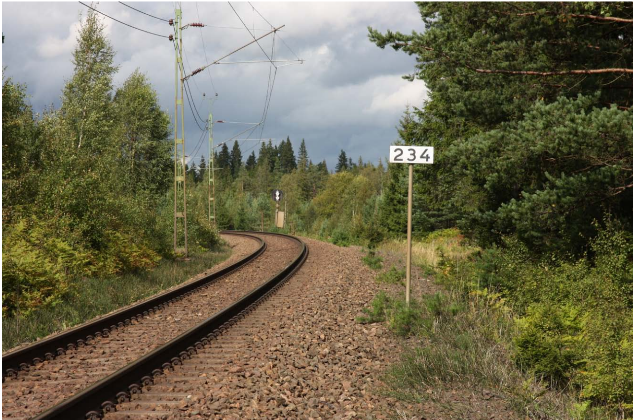
Nuvarande spår i höjd med Jakobshyttan.

Projektet Hallsberg–Degerön är uppdelat i delprojekt vilka alla är i olika skeden. Vi tycker att det är viktigt att du som berörs av projektet är informerad om vad som händer på de olika sträckorna. Du kommer att få fler informationsblad när vi har något nytt att berätta.