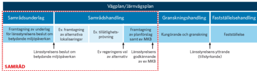
Figur 1 visar Trafikverkets planläggningsprocess för väg- och järnvägsplaner.

Vi tar nu fram en järnvägsplan för att utreda var järnvägen ska ligga och hur den ska se ut. Planprocessen syftar också till att säkra de markområden som krävs för att bygga ut järnvägen, såväl permanent som tillfälligt.