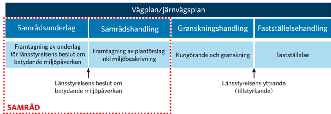
Figur 1 Trafikverkets planläggningsprocess