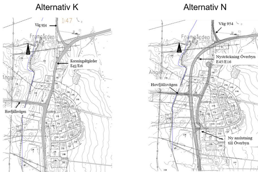
Figur 1. Karta över alternativen. Alternativen benämns alternativ K för korsningsåtgärder och alternativ N för väg i nysträckning förbi Överbyn.

Vid upprättande av vägplanens samrådsunderlag framkom det under arbetets gång att korsningsåtgärderna skulle medföra intrång på omgivande fastigheter och sannolikt resultera i betydande negativa konsekvenser för boende och trafiken på E45/E16 under byggtiden. I detta skede identifierades även ett möjligt alternativ för E45/E16, i nysträckning väster om Överbyn. En inledande studie av de två alternativen visade att det fanns anledning att fördjupa utredningen. Därmed fortsatte arbetet i samrådsunderlaget med de båda möjliga alternativen som visas i Figur 1.