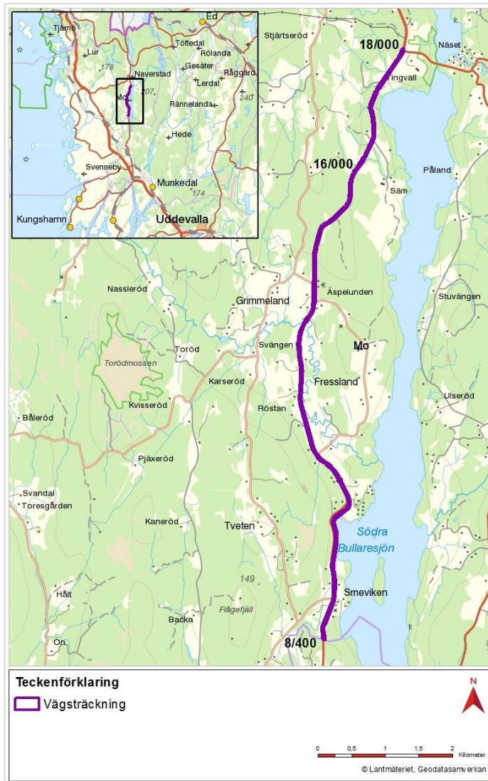
Orienteringskarta med aktuell del av väg 165, Smeviken-Tingvall.