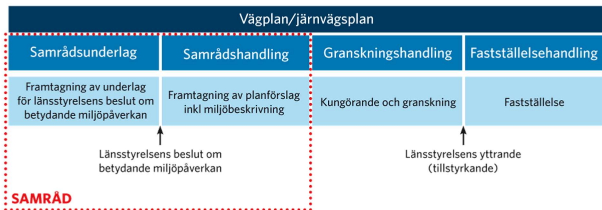
Figur 1: Trafikverkets planprocess för projektet Hemmesta vägskäl.

Fastställelsehandling innebär att den formella handläggningen av planen provas inför beslut om fastställelse av planen. I fastställelseprövningen kontrolleras att projektet har drivits enligt gällande lagstiftning, att tillräcklig samråd har hållits och att hänsyn till miljö har tagits. Om planen blir godkänd fastställs den. Planens fastställelse kommer att annonseras ut i lokalpressen samt skickas ut till berörda fastighetsägare och myndigheter via brev. Trafikverket kan efter att fastställelseprövningen vunnit laga kraft ta marken i anspråk för att påbörja byggnation. Fastställelsebeslutet kan överklagas och provas då av regeringen.