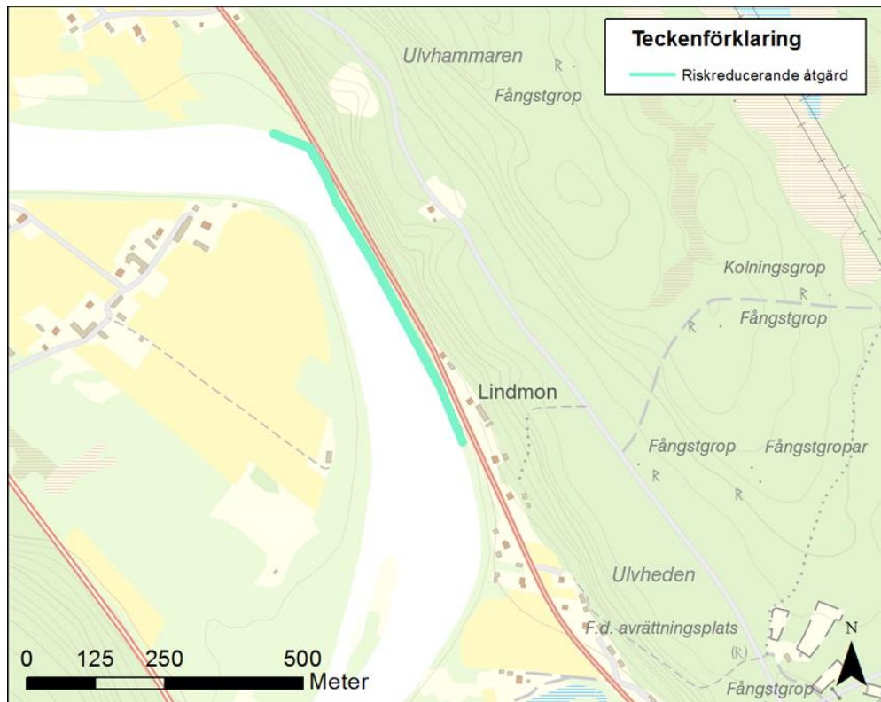
Figur 2. Översikt över riskreducerande åtgärdsobjektet vid Lindmon.

Vid Lindmon är den enda möjliga åtgärden för att behålla vägens funktion att med en tryckbank/erosionsskydd säkra vägen mot ras i befintligt läge. Tryckbank/erosionsskydd kan naturanpassas men kan medföra skada på Natura 2000.