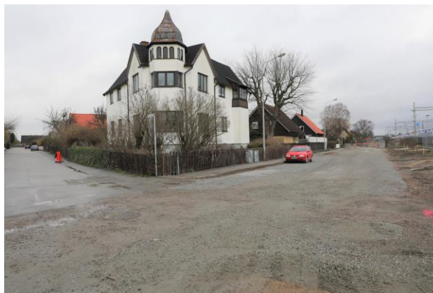
Här kommer arbetsområdet för slitsmurar vara.

Har du frågor svarar vi gärna på dem, kontaktuppgifter ser du nedan.