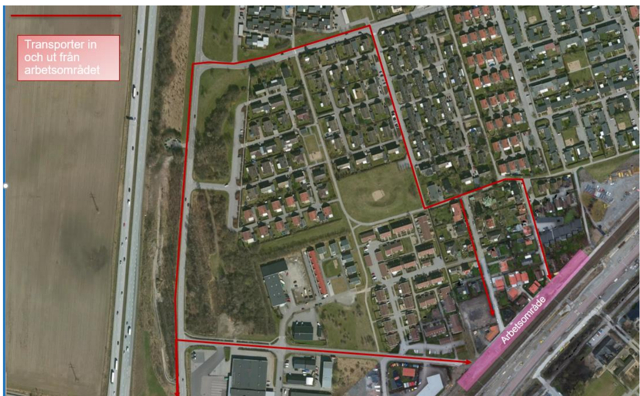
Transportvägar och arbetsområde för slitsmursarbetet.

Transporter med material kommer tas in på rödmarkerade vägar, se bilden nedan. Vakter kommer vid vissa tillfällen att stå och bevaka in- och utfart förbi Svanetorpsvägens lekplats och gångväg som sedan en längre tid är öppen för biltrafik.