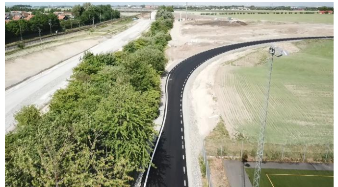
Den tillfälliga vägen kommer att användas under tiden som Stationsvägen är avstängd.

En anslutningsväg har också byggts från Villavägen till Dalslundskolans parkering. Anslutningen ska endast användas av ersättningsbussar då tågen är inställda. Under tiden då den tillfälliga ersättningsvägen är i bruk kommer parkering vara förbjuden på Villavägen.