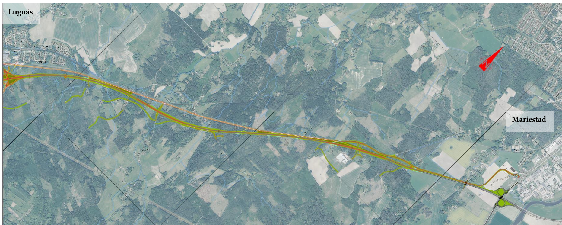
Kartbild över väglinjen.