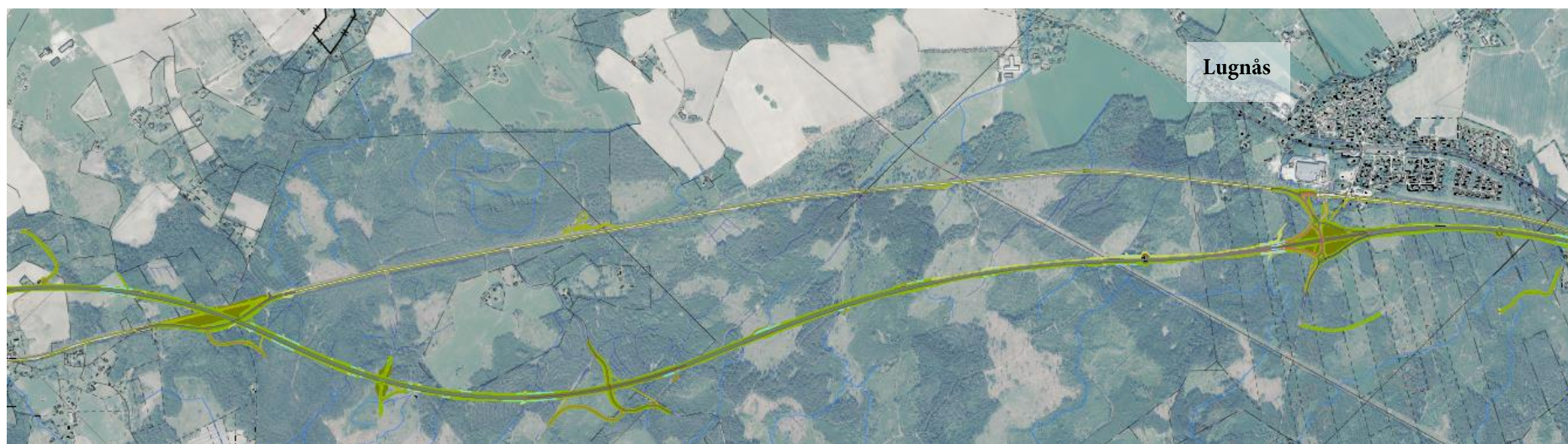
Kartbild över väglinjen.