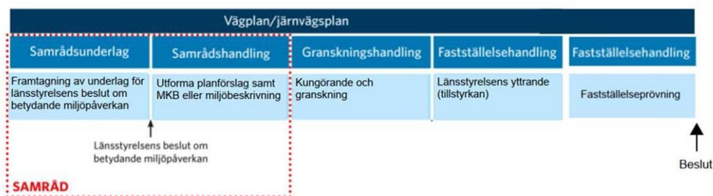
Figur 1. Planläggningsprocessen.

Byggstart kan ske tidigast då vägplanen vunnit laga kraft.