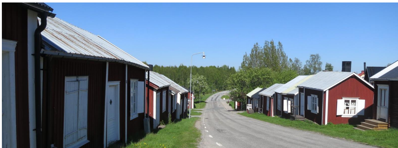
Rutviksvägen, foto Ramböll.

Vi hoppas på överseende med att det blir stökigt en tid i området. Alla arbeten beräknas vara klara hösten 2021.